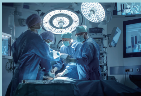
スマートヘルスケア