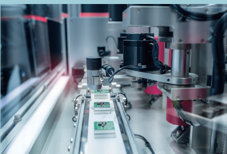
スマートマニュファクチャリング